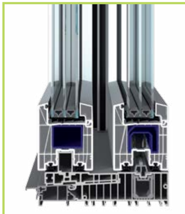
evolutionDrive: HST - Emelő-tolóajtó